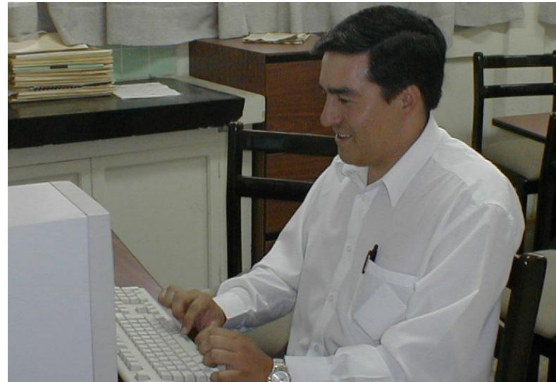
Aula de Residentes de Postgrado de Gineco-Obstetricia