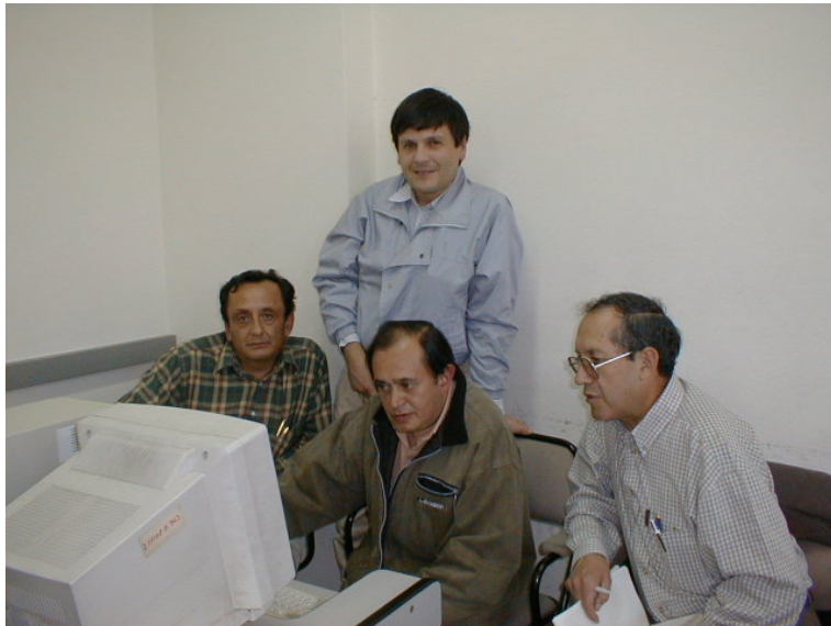
En el Centro Obstétrico